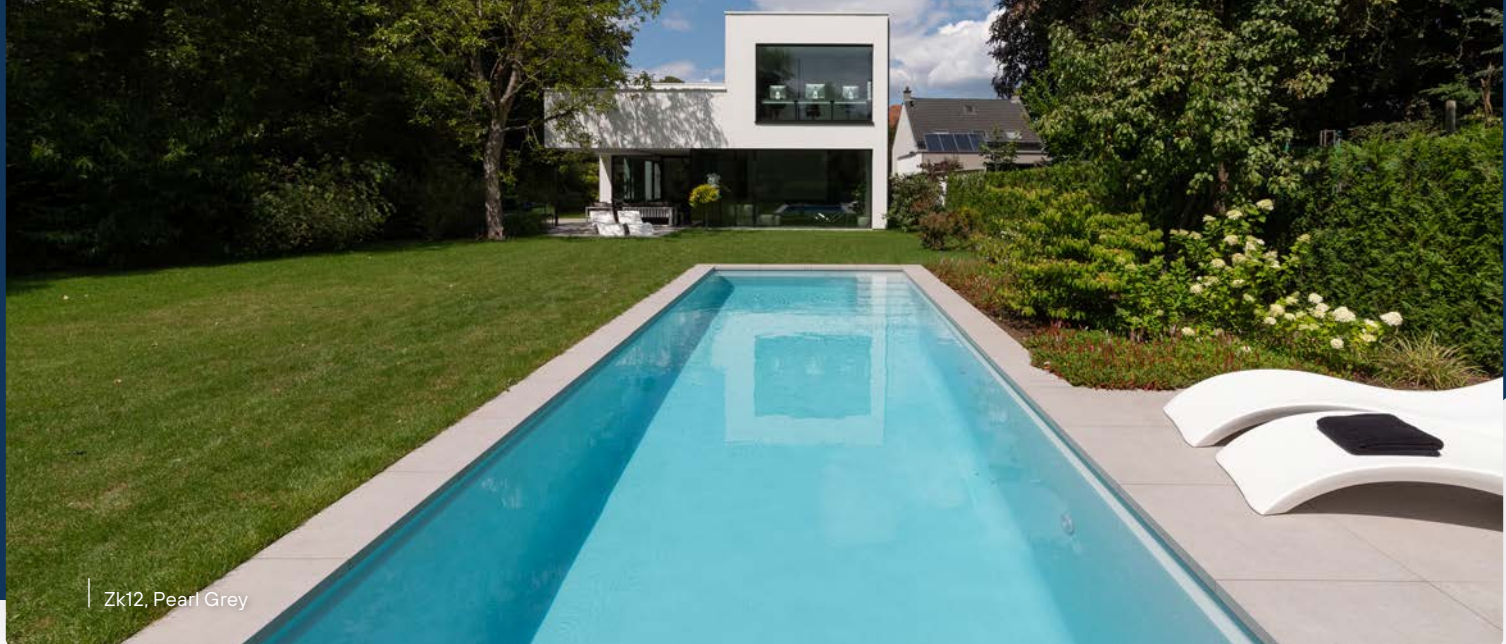
Zk12, Pearl Grey