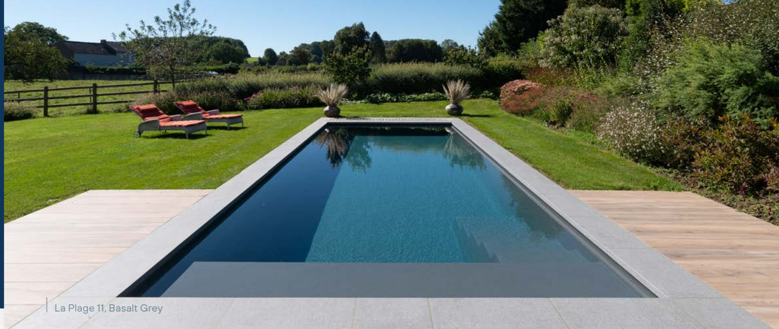
La Plage 11, Basalt Grey