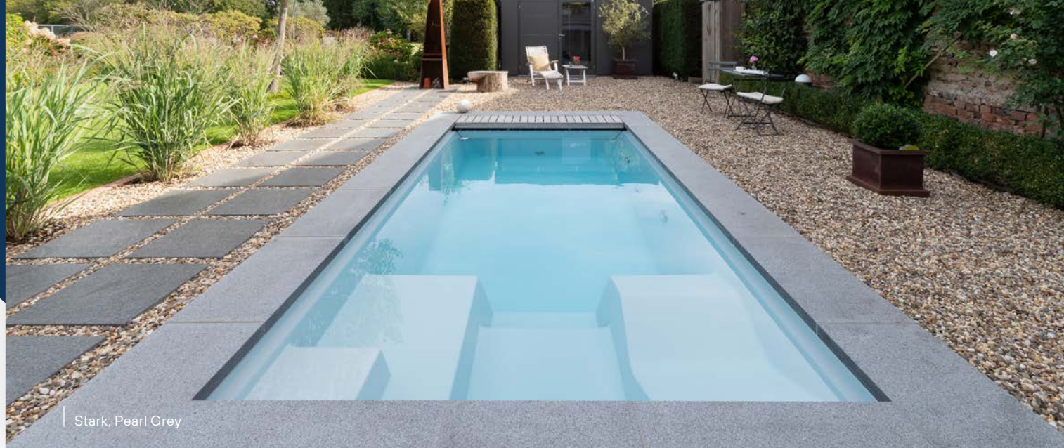
Stark, Pearl Grey