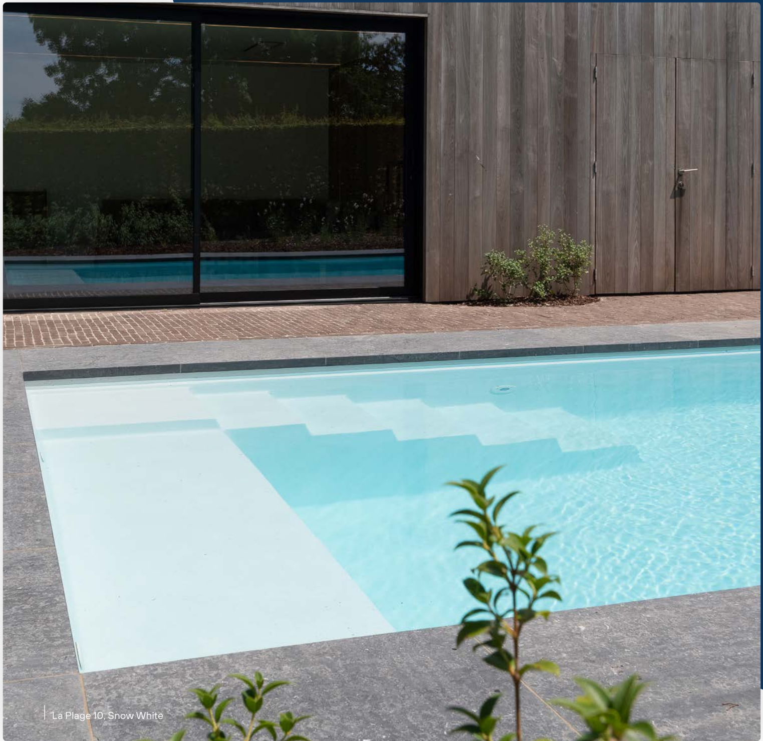
La Plage 10, Snow White