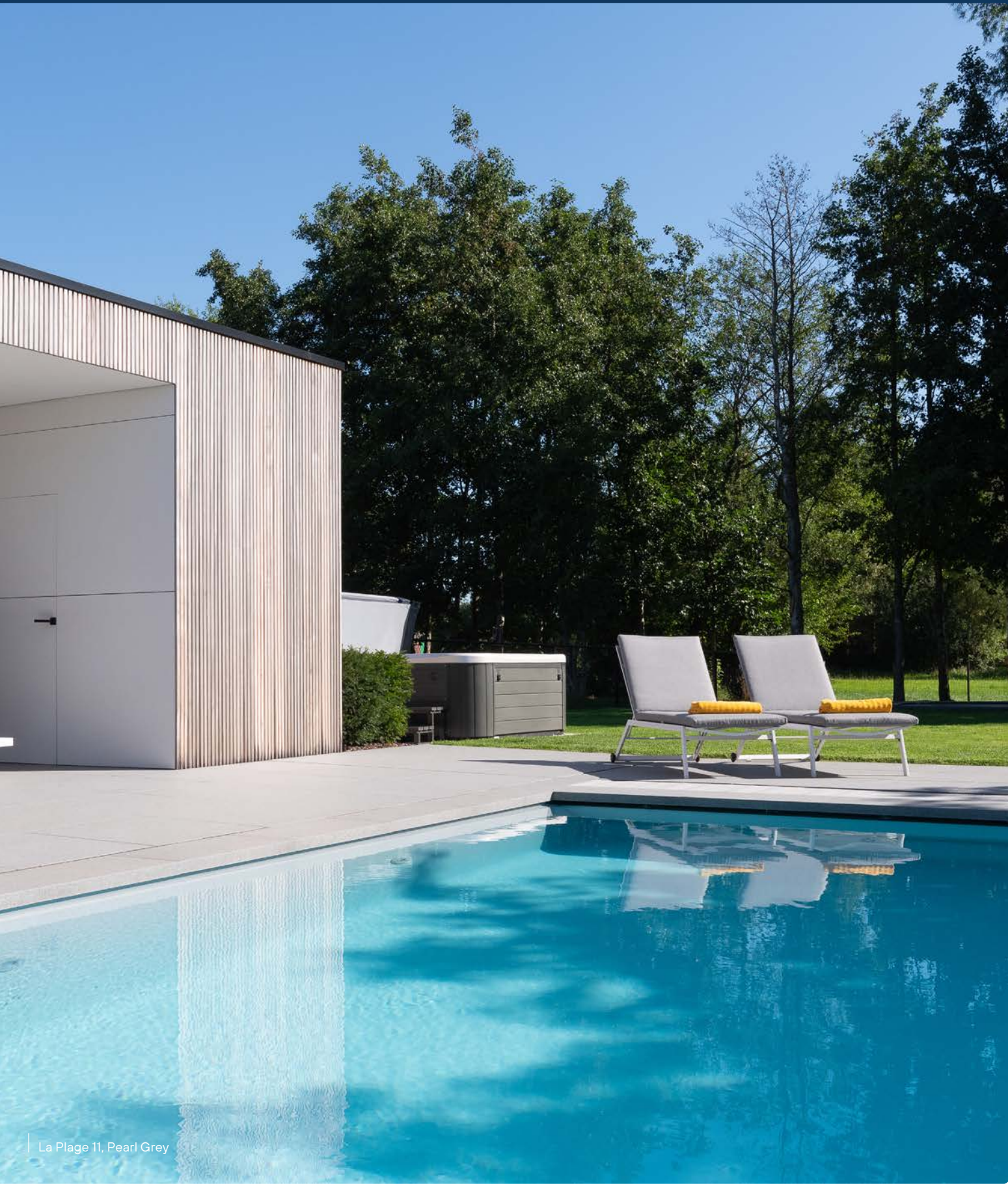
La Plage 11, Pearl Grey